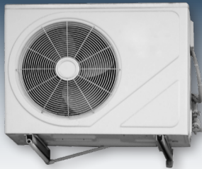
Klimaanlagen und Wärmepumpen eignen sich hervorragend für den Betrieb mit Solarstrom.

Auch durch die Speicherung von Strom kann die Eigenverbrauchsquote weiter erhöht werden. Die sinnvolle Nutzung von Speichern lässt sich aber insbesondere durch sich daraus ergebende Zusatznutzen definieren.