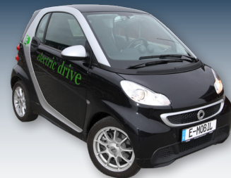
Elektroautos können Solarstrom wirtschaftlich speichern und machen so umweltfreundlich mobil.