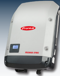
Wechselrichter mit integrierten Energiemanagementfunktionen sorgen für eine maximale Stromausnutzung unter Einhaltung aller Netzanforderungen.