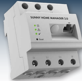
Intelligente Geräte gewährleisten ein vollautomatisches Lastmanagement.