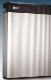
Batteriespeicher ermöglichen den Verbrauch von Solarstrom auch am Abend und in der Nacht.