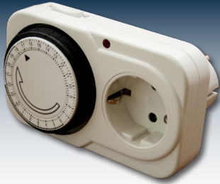
Zeitschaltuhren als einfachste Form des Lastmanagements.

Insbesondere Verbraucher, die nicht an bestimmte Betriebszeiten gebunden sind, lassen sich so äußerst rentabel direkt mit Solarstrom betreiben. Moderne Technik bringt Verbrauch und Erzeugung in Einklang.